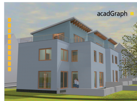
Eine repräsentative Visualisierung des Modells eines Reihenhauses.

Erfahren Sie mehr über die Möglichkeiten, Informationen mit anderen Projektbeteiligten auszutauschen und wählen Sie die richtige Methode für den Datenaustausch.